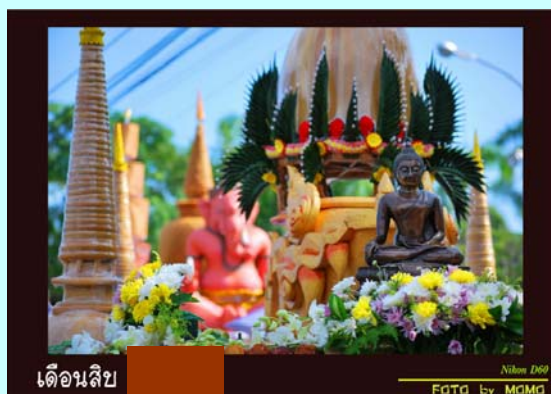
เดือนสิบ

ปิดท้ายพักเที่ยงด้วยคำคมโดยท่าน ว.วชิรเมธี “ ยศ ทรัพย์ อำนาจเป็นเพียงมรรควิธีที่ทำให้ชีวิตนี้มี ประโยชน์ต่อเพื่อนมนุษย์ โปรดอย่าเข้าใจผิดว่าเป็นเป้าหมายในการเกิดเป็นมนุษย์ ” สวัสดีค่ะ