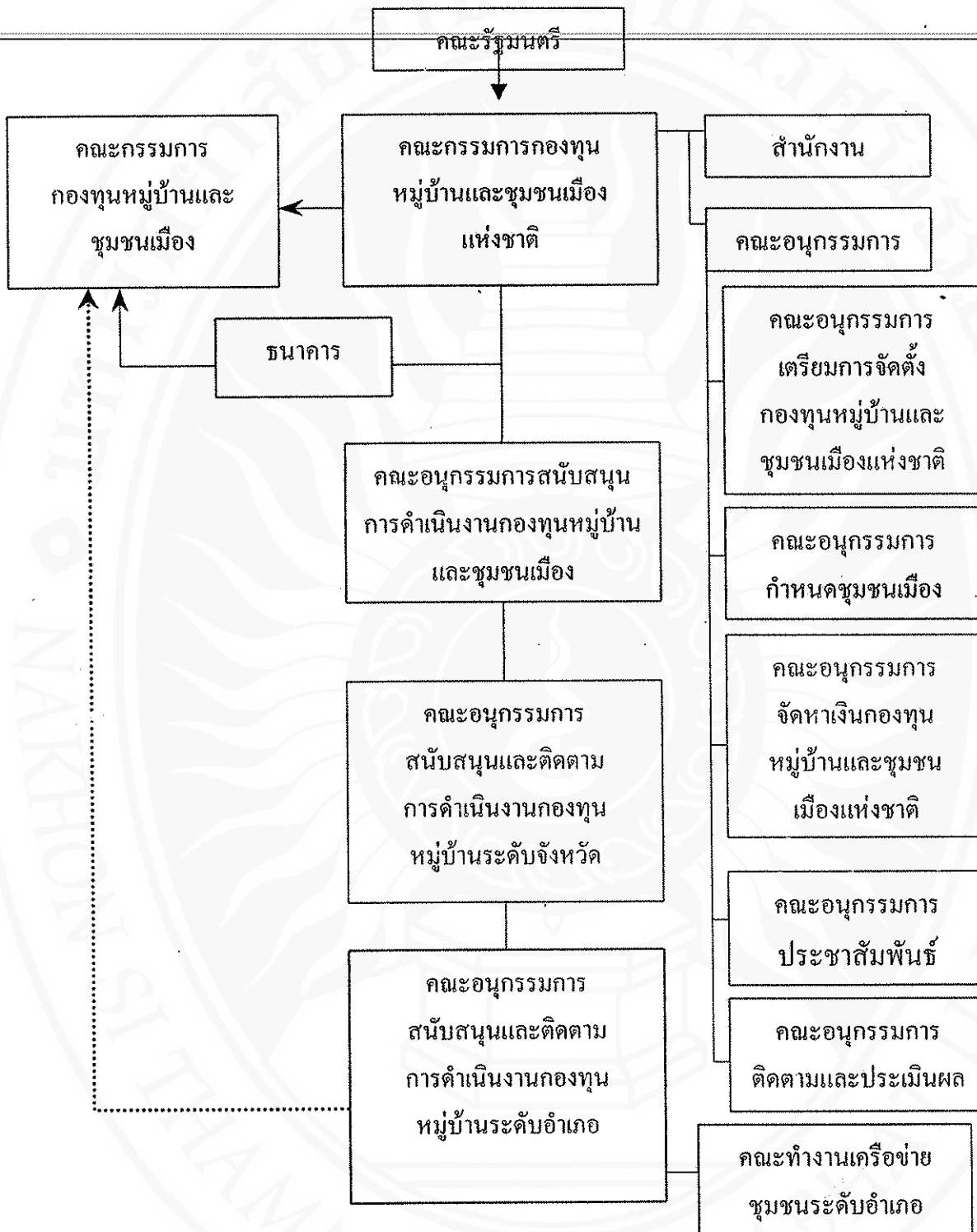
ภาพที่ 2 แผนภูมิโครงสร้างกลไกในการบริหารกองทุนหมู่บ้านและชุมชนเมือง