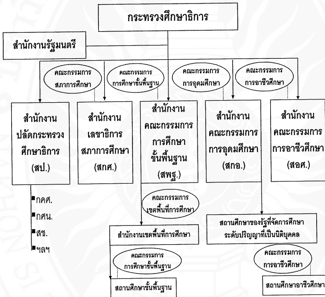
ภาพที่ 1 โครงสร้างการบริหารจัดการศึกษาของกระทรวงศึกษาธิการ

จากการปฏิรูประบบบริหารราชการและการจัดการศึกษา ได้หลอมรวมหน่วยงานทางการศึกษา ซึ่งประกอบด้วย ทบวงมหาวิทยาลัย สำนักงานคณะกรรมการการศึกษาแห่งชาติ และกระทรวงศึกษาธิการเป็นหน่วยงานเดียวกัน คือกระทรวงศึกษาธิการ ซึ่งการบริหารราชการตามโครงสร้างใหม่ ได้จัดระเบียบการบริหารราชการออกเป็น 3 ส่วน ดังภาพที่ 1