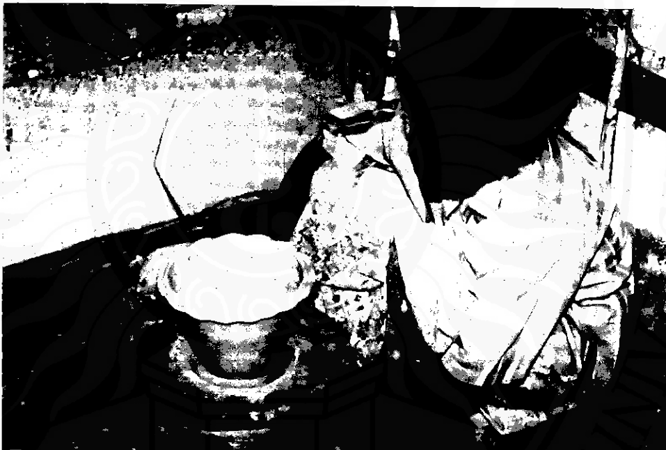
ภาพที่ ๓ ชั้นการปั้นหรือขึ้นรูป นิยมใช้แป้นหมุนขึ้นรูปผลิตภัณฑ์ที่เป็นทรงกลม

จะต้องมีความชำนาญเป็นพิเศษ เพราะมักใช้ผู้ปั้น เพียงคนเดียว เมื่อวางดินเข้าสู่ศูนย์กลางของแป้นแล้ว นิยมใช้มือขวาหมุนมือน ใช้มือซ้ายจับดินให้เข้าสู่