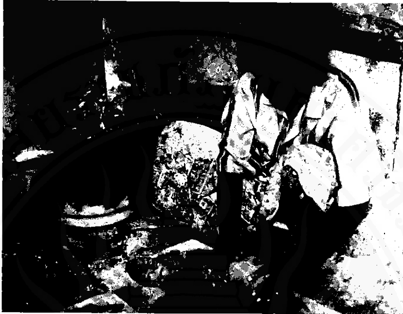
ภาพที่ ๒ ชั้นนวดดิน บางแห่งใช้มือนวด บางแห่งใช้เท้า เพื่อให้เนื้อดินเข้ากันให้ดีเสียก่อนจึงจะขึ้นรูปผลิตภัณฑ์