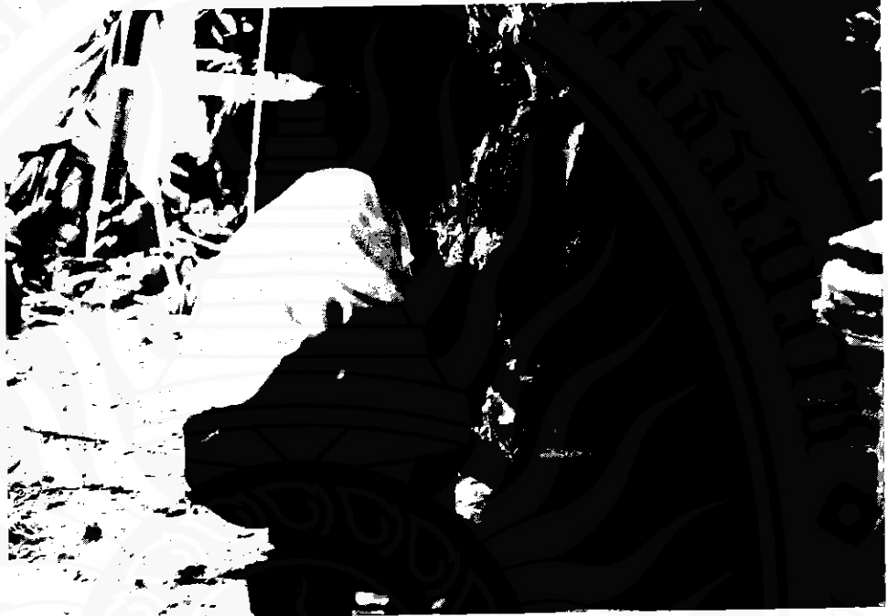
ภาพที่ ๑ ชั้นเตรียมดิน มักจะหาดินในท้องถิ่นใกล้หมู่บ้านมาเป็นวัตถุดิบสำหรับปั้น เมื่อได้ดินมาแล้วจึงนวด และคัดเศษวัสดุที่ติดเนื้อดินออก โดยใช้ไม้ไผ่บางมาตัดดิน (ระยะหลังนิยมใช้ลวดตัดแทน)

ใช้ไม้ไผ่บางซึ่งเรียกว่า "ไม้ไผ่จาก" ตัดเป็นชิ้นบางๆ ขนาดความหนาประมาณหนึ่งเซนติเมตร กว้าง ๓-๕ เซนติเมตร ถ้าพบเศษใบไม้ก่อนกรวด ก้อนหิน ก็จะเลือกออกเสีย จากนั้นก็ใช้น้ำราดลงตามความเหมาะสม ใช้พลาสติกคลุมไว้หนึ่งคืน จึงลงมือโรยทรายบนพื้นลานประมาณ ๑/๔ ของดินที่เตรียมไว้ ใช้เท้านวดหรือเหยียบให้ดินกับทรายเข้ากันสนิท ถ้าภาชนะขนาดใหญ่ต้องผสมทรายมากกว่าภาชนะขนาดเล็ก เมื่อผสมดินได้ที่แล้วก็นำมาทำเป็นแผ่นขนาด ๒๕x๔๐ เซนติเมตร หนาประมาณ ๓-๕ เซนติเมตร ใช้พลาสติกคลุมไว้เพื่อเตรียมนวดต่อไป