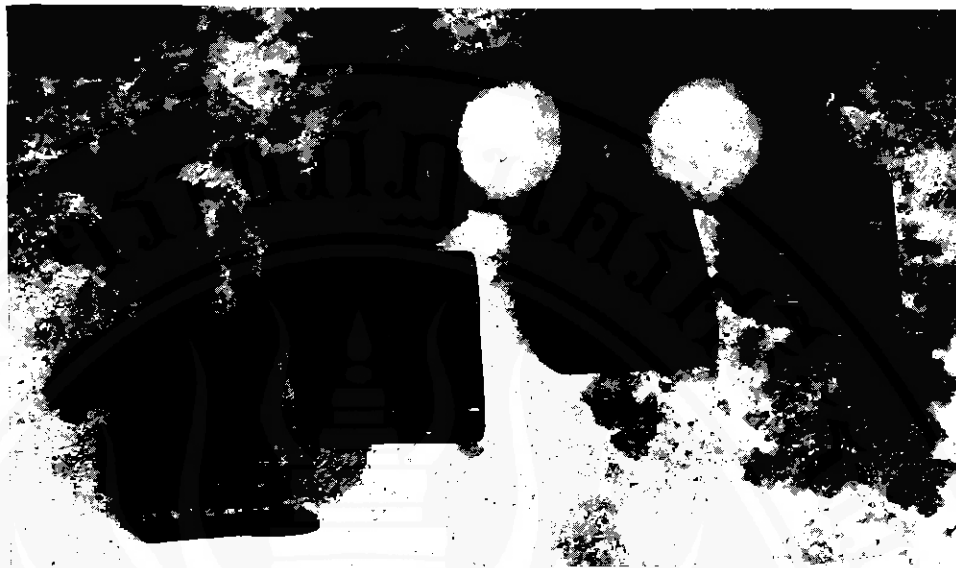
ภาพที่ ๕ ชั้นตากและตากแต่ง ช่างปั้นจะใช้เครื่องมือเหล่านี้ตัดแต่งผลิตภัณฑ์หม้อดิน ไม้แบนเรียกว่า "ไม้ตี" ส่วนลูกกลมๆ คล้ายดอกเห็ด คือ "ลูกตุ้ง" (หรือลูกถือ หรือหินตุ)

๕. ชั้นเผา ช่างปั้นจะลำเลียงผลิตภัณฑ์ที่ แห้งสนิทเข้าเตาเผาในตอนเย็นหรือเช้าตรู่เริ่มเผาตั้งแต่ เช้า ในช่วงแรกจะใช้ไฟอ่อนๆ ประมาณ ๖ ชั่วโมง เรียกว่า "รม" หลังจากนั้นก็ค่อยๆ เรังไฟทีละน้อย เมื่อ ถึงชั่วโมงที่ ๑๐ จึงเร่งไฟจนกระทั่งเปลวไฟสีแดงสูงพ้น จากแนวของหลังเตาเผา หรือสูงพ้นจากแนวของผลิต ภัณฑ์ที่เผานั้น ต้องยื่นไฟเช่นนี้อยู่ระยะเวลาหนึ่ง จาก นั้นก็ค่อยๆ เอาไฟออกจากปากเตา ทิ้งไว้หนึ่งคืนจึงจะ ลำเลียงออกจากเตาเผาพร้อมเวลาดังตั้งขึ้นนำผลิตภัณฑ์ เข้าเตาจนถึงชั้นลำเลียงออกประมาณ ๒๔-๓๐ ชั่วโมง