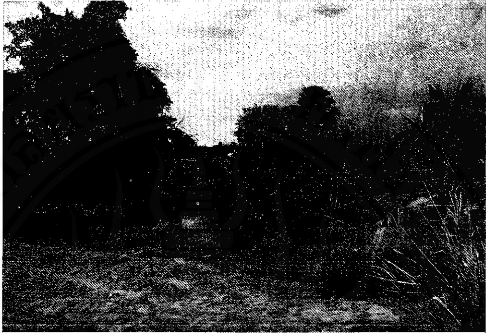
สภาพพื้นที่ด้านตะวันออกของบ้านพังสิงห์เป็นท้องทุ่งกว้าง พื้นดินเป็นทรายร่วน แต่เดิมเป็นดินตะกอนอันเกิดจากการกวาดของน้ำทะเลในอ่าวไทย