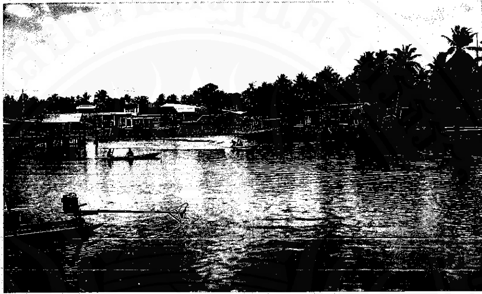
คลองท่าแพ เส้นทางคมนาคมเข้าออกอำเภอไทยอีกทางหนึ่ง ของชาวนครในสมัยโบราณ (มิถุนายน ๒๕๔๑)