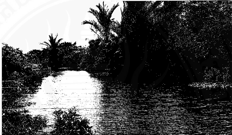
คลองขุนน้ำท่าจั่ว (คลองบ้านตาล) ไหลผ่านตำบลท่าจั่วเข้ามาในพื้นที่ตำบลนาทราย ในที่สุดคลองนี้ก็สิ้นสุดลงที่บ้านปลายท่า (หมู่ที่ ๑) ตำบลนาทราย อำเภอเมือง จังหวัดนครศรีธรรมราช