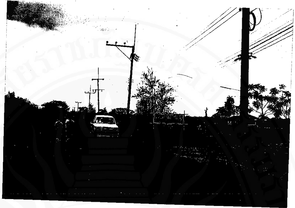
ถนนบุณฑ (ระยะทาง ๓.๖๔ กม.)

เป็นเส้นทางเข้าออกหมู่บ้านตลาดนัดที่จัดว่าสะดวกกว่าเส้นทางอื่น ที่สวนทิวทวารวราชที่มีวิทยาลัยสารพัดช่างนครศรีธรรมราชตั้งอยู่