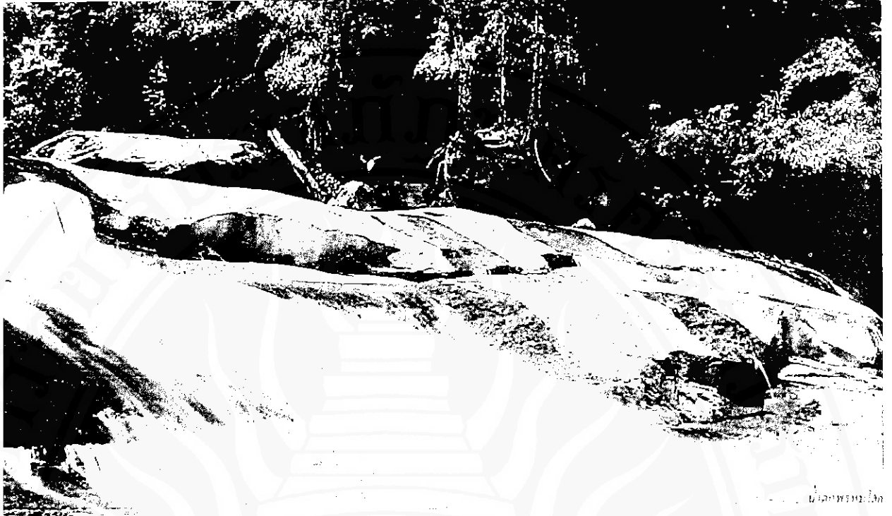
น้ำตกพรหมโลก : ทรัพยากรท่องเที่ยวธรรมชาติ

ถ้อยแถลงของนักท่องเที่ยวต่างประเทศที่เดินทางมาเยือนประเทศไทยในปี พ.ศ.๒๕๓๓-๒๕๓๔ มีจำนวนกว่าปีละ ๕ ล้านคน ทั้งนี้ ยังไม่นับคนไทยที่เดินทางจากบ้านไปเยือนจังหวัดอื่นๆ อีกจำนวนมาก