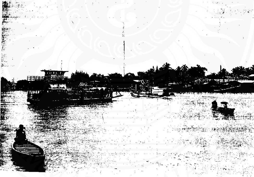
ปากน้ำปากพอง : ทวีปยากรท่องเที่ยวธรรมชาติ

๑.๔ กิจกรรมเฉพาะอย่าง เช่น การแสดงพื้นบ้าน การชนโค ที่สามารถจัดเป็นกิจกรรมเพื่อการท่องเที่ยวได้อย่างดี