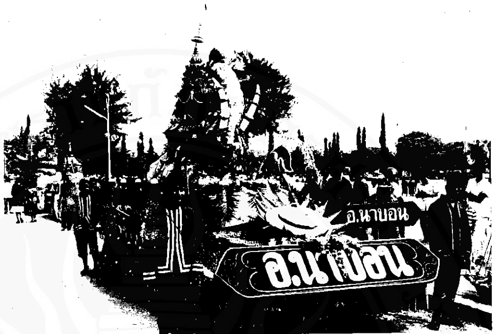
ขบวนแห่หมรับ : ทรัพยากรท่องเที่ยว ตามเทศกาล