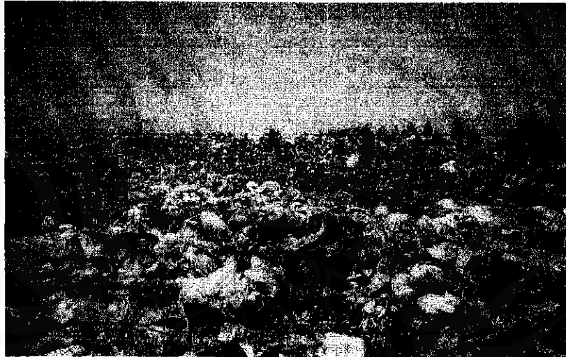
ภาพที่ 1 สภาพทั่วไปของ "ออฟฟิศ" ของกลุ่มคนเก็บ (กองขยะ)

เมื่อชุมชนมีสภาพทางเศรษฐกิจดีขึ้น (เทศบาลตำบลปากแพรก : 7) ฯลฯ เมื่อเก็บได้แล้วก็จะนำไปจำหน่ายยังร้านที่รับซื้อ หรือบางคนก็อาจจะรอจำหน่ายในบริเวณโรงงานกำจัดขยะ เพราะจะมีรถเข้ามารับซื้อถึงที่ แต่จะซื้อในราคาที่ถูกลงกว่า ดังนั้นบางคนที่ไม่สะดวกที่จะขนย้ายขยะเพื่อนำออกไปจำหน่ายยังร้านที่รับซื้อก็จะจำหน่ายกับรถที่เข้ามารับซื้อ แต่ในขณะที่บางคนที่สามารถนำออกไปจำหน่ายยังร้านที่รับซื้อข้างนอกได้ก็จะนำออกไปจำหน่ายเอง เพราะจะได้ราคาดีกว่า สำหรับคนที่ต้องการจะนำขยะไปจำหน่ายยังร้านรับซื้อข้างนอก แต่ไม่มีพาหนะเป็นของตนเองก็จะเหมารถขนย้ายขยะออกไป โดยต้องจ่ายค่าเหมารถเที่ยวละ 150 บาท