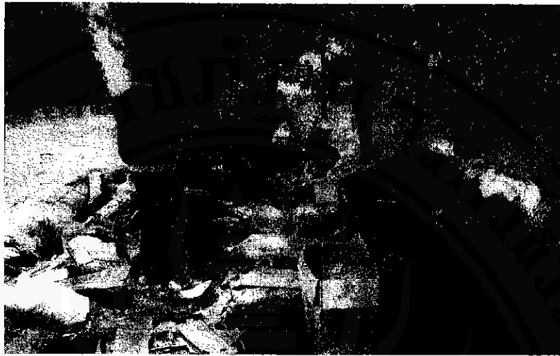
ภาพที่ 3 ที่พักแห่งหนึ่ง (ได้รื้อไม้) ภายในออฟฟิศ