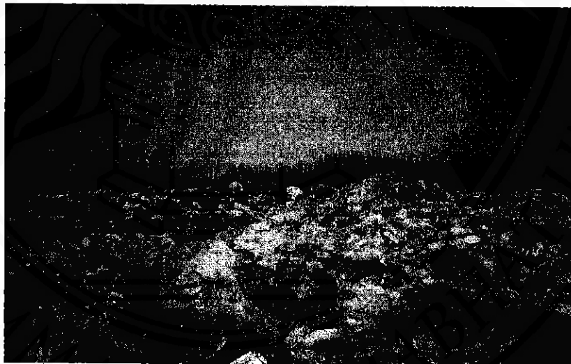
ภาพที่ 6 “ขยะ” ทรัพยากร “ชายขอบ”

ความหลากหลายของทรัพยากร “ขยะ” เมื่อถูกนำมาคัดเลือก ผ่านกระบวนการต่างๆ โดยวิธีการของคนกลุ่มเก็บขยะยังชีพ พบว่า ขยะสามารถแปลงคุณค่าของมันเป็นเงินตรา และเขาได้นำ “สินค้า” เหล่านี้ส่งกลับคืนให้แก่กลุ่มคนที่อยู่ในเมือง หรือส่งเข้าสู่ระบบการผลิตของเมือง เช่น โรงงานอุตสาหกรรมต่างๆ ด้วยเหตุนี้เมื่อทรัพยากรขยะถูกแปลงโฉมให้เป็นสินค้าแล้ว ขยะก็ได้หันกลับเข้าสู่ระบบการผลิตและบริโภคของกลุ่มคนที่อยู่ในเมืองอีกครั้งหนึ่ง