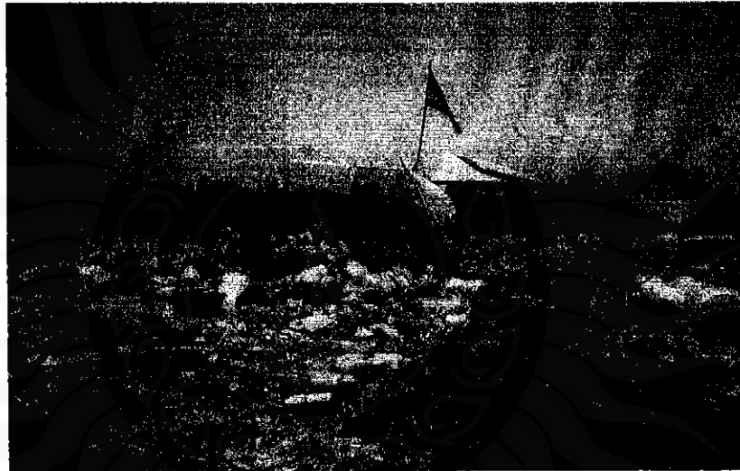
ภาพที่ 2 ที่พัก (เพิง) ภายในออฟฟิศ

ภายในบริเวณกองขยะ หรือ “ออฟฟิศ” (Office) ของกลุ่มคนหลักกลุ่มนี้ จะมีการสร้างเพิง ขึ้นเพื่อใช้สำหรับหลบแดด หลบฝนในแต่ละวัน ซึ่งเป็นการสร้างเพิงขึ้นแบบง่ายๆ ไม่มีความ ทนทานมากนัก แต่ก็พอเป็นที่ที่ใช้หลบแดด หลบฝนได้ หากฝนตกไม่หนักมากนัก โดยพวกเขา จะใช้เพิงเป็นสถานที่ที่ทำการคัดแยกขยะ นั่นก็คือว่าเมื่อพวกเขาเก็บขยะมาได้ส่วนหนึ่ง พวกเขาก็ จะนำขยะที่เก็บมาได้กลับมาไว้ที่เพิงเพื่อทำการคัดแยกขยะออกเป็นประเภทๆ พร้อมทั้งทำการ บรรจุกระสอบ หรือถุงพลาสติกต่างๆ ที่เตรียมไว้ เพื่อรอจำหน่าย แต่ก็มีอีกหลายๆ คนที่ไม่มีเพิง โดยกลุ่มที่ไม่มีเพิง ก็จะใช้ประโยชน์จากใต้ร่มไม้ เป็นสถานที่ที่ทำการคัดแยกขยะ แต่กลุ่มนี้จะ ค่อนข้างลำบากนิดหนึ่ง เพราะได้ร่มไม้จะอยู่ห่างออกไปจากกองขยะเล็กน้อย ไม่เหมือนกับเพิงที่ สร้างขึ้นในบริเวณกองขยะ จึงทำให้มีความสะดวกในการขนหรือนำขยะมาคัดแยกมากกว่า