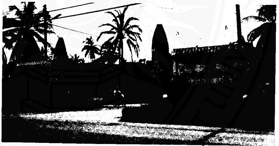
อาคารที่เคยใช้เป็นที่พักอบรมและปฏิบัติการสานลิภาเมื่อ พ.ศ.๒๕๑๗

ซึ่งร้อยเอกเผื่อน คงเอียง เริ่มฝึกหัดที่นี่