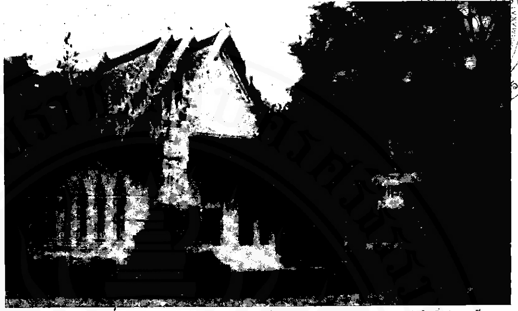
วัดมะนาวหวาน วัดสำคัญในกิ่งอำเภอข้างกลาง

เฉพาะอำเภอเฉลิมพระเกียรติ จังหวัด นครศรีธรรมราช ประกอบด้วยท้องที่สามตำบล ของอำเภอเชียรใหญ่ คือตำบลเชียรเขา ตำบลดอน ทราย และตำบลสวนหลวง มาผนวกกับตำบลทาง พูน อำเภอร่อนพิบูลย์ เป็นการยกฐานะเป็นอำเภอ โดยไม่ต้องผ่านขั้นตอนการเป็นกิ่งอำเภอ ได้จัดตั้ง สำนักงานชั่วคราวที่อาคารเรียน โรงเรียนวัดสระ ไทร หมู่ที่ ๕ ตำบลเชียรเขา เปิดทำการวันแรกคือ วันที่ ๖ ธันวาคม ๒๕๓๕ ต่อมาได้สร้างอาคารที่ว่าการถาวรขึ้นและเปิดใช้เมื่อเดือนตุลาคม ๒๕๔๐ โดยมีตราสัญลักษณ์ฉลองสิริราชสมบัติครบ ๕๐ ปี ประดับไว้ที่อาคารที่ว่าการอำเภอสืบมา