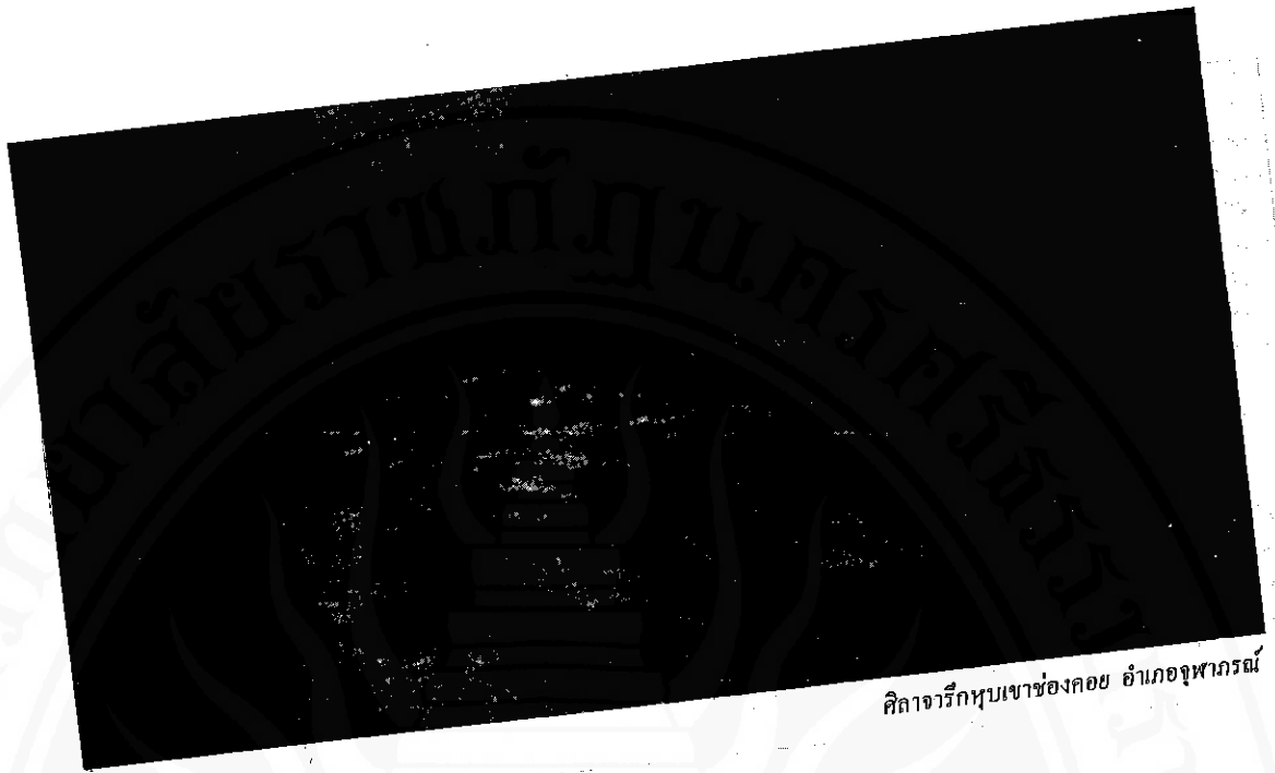
คณาจารย์หุบเขาช่องคอก อำเภอกุพากรณ์