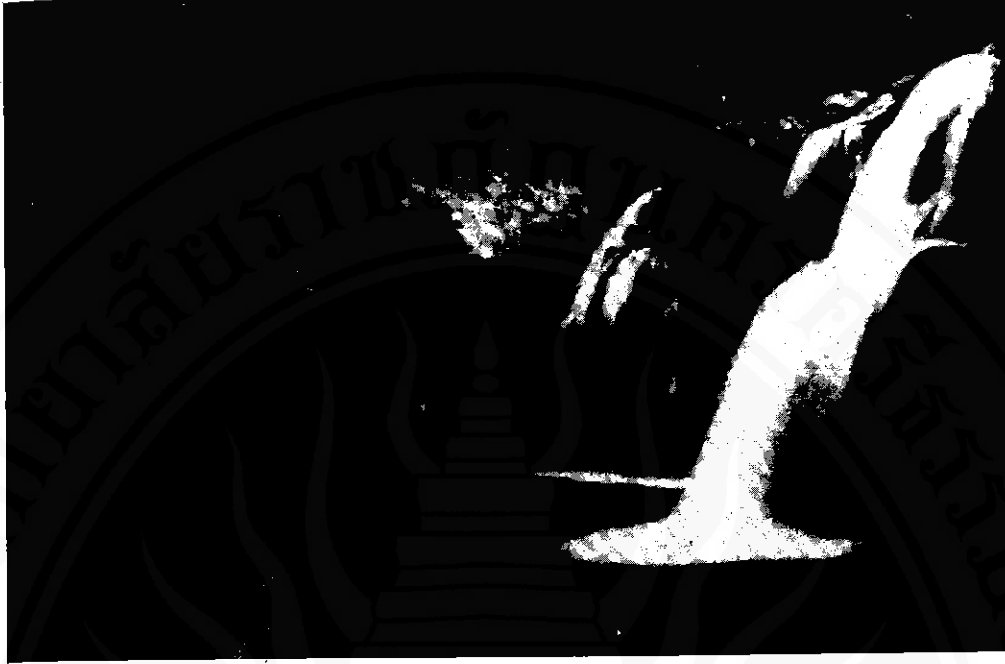
น้ำตกกรุงชิง สถานที่แห่งอำเภอนบพิตำ