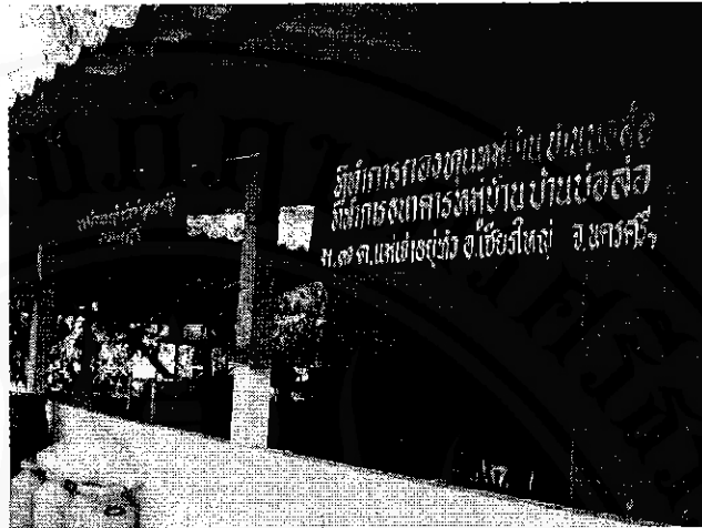
ภาพที่ 2 ที่ทำการกลุ่มหัตถกรรมกะลามะพร้าว หมู่ที่ 7 ตำบลแม่เจ้าอยู่หัว อำเภอเชียรใหญ่ จังหวัดนครศรีธรรมราช

กลุ่มหัตถกรรมกะลามะพร้าว หมู่ที่ 7 ตำบลแม่เจ้าอยู่หัว อำเภอเชียรใหญ่ จังหวัดนครศรีธรรมราช เป็นกลุ่มหัตถกรรมกะลามะพร้าวที่จัดตั้งขึ้นโดยมีวัตถุประสงค์ เพื่อให้สมาชิกมีรายได้เสริมในครอบครัวและลดปัญหาการว่างงานหลังจากฤดูทำงาน ใช้เวลาว่างให้เกิดประโยชน์ กลุ่มที่ว่างงานในตำบลได้มีงานทำจากวัสดุที่เหลือใช้ในท้องถิ่นที่มีอยู่ เช่น กะลามะพร้าว โดยนำมาแปรรูปเป็นผลิตภัณฑ์ต่าง ๆ และรวมภูมิปัญญาในท้องถิ่น ตลอดจนก่อให้เกิดการมีส่วนร่วมของชุมชน และคนที่มีภูมิปัญญาในเรื่องหัตถกรรมด้านต่าง ๆ ได้ถ่ายทอดความรู้ให้กับเยาวชนในท้องถิ่นและฝึกความสามัคคีในการดำเนินงานธุรกิจแบบกลุ่มย่อย