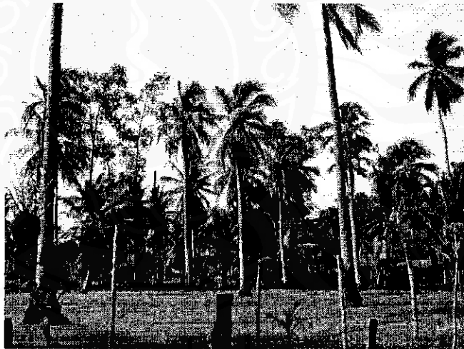
ภาพที่ 8 แหล่งวัตถุดิบที่มีอยู่มากมายในพื้นที่หมู่ที่ 7 ตำบลแม่เจ้าอยู่หัว

อย่างไรก็ตามกะลามะพร้าวซึ่งเป็นวัตถุดิบสำคัญในการทำผลิตภัณฑ์ของกลุ่มหัตถกรรมกะลามะพร้าว หมู่ที่ 7 ตำบลแม่เจ้าอยู่หัว ยังมีอยู่มากในท้องถิ่น เนื่องจากทางกลุ่มเพิ่งก่อตั้งกลุ่มทำผลิตภัณฑ์จากกะลามะพร้าวมาได้ประมาณ 1 ปีกว่า ๆ ทำให้กะลามะพร้าวยังคงมีอยู่มากในท้องถิ่น เพราะปริมาณการใช้กะลามะพร้าวของกลุ่มยังไม่มากนัก