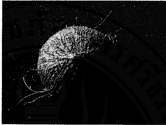
ภาพที่ 7 “กะลามะพร้าวตัวผู้” วัตถุดิบสำคัญในการทำผลิตภัณฑ์

2. ไม้ที่ใช้ประกอบรูปทรงของผลิตภัณฑ์ ผลิตภัณฑ์จากกะลามะพร้าวบางอย่าง ที่มีด้ามจับ เช่น ตะหลิว ทักษี จวกตักแกง แก้วน้ำ แก้วไวน์ ฯลฯ หรือของใช้ตกแต่งบ้าน เป็นรูปต่าง ๆ เช่น นก ปลา กัด กุ้ง เต่า เสากระโคงของเรือใบ ฯลฯ ผลิตภัณฑ์เหล่านี้ ต้องใช้ไม้ทำเป็นด้ามจับ หรือทำเป็นอวัยวะส่วนต่าง ๆ ของตัวสัตว์ เช่น หู ปาก คอ ที่ต่อจาก ส่วนของตัวสัตว์ ไม้ที่ใช้ประกอบรูปทรงของผลิตภัณฑ์จากกะลามะพร้าวดังกล่าว ได้แก่ ไม้ซี่ เหล็ก ไม้มะพร้าว ไม้ตาล และไม้ประดู่ เป็นต้น