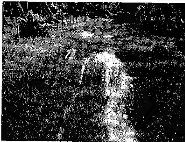
ภาพที่ 1 ทางเข้ากลุ่มหัตถกรรมกะลามะพร้าว หมู่ที่ 7 ตำบลแม่เจ้าอยู่หัว อำเภอเชียรใหญ่ จังหวัดนครศรีธรรมราช