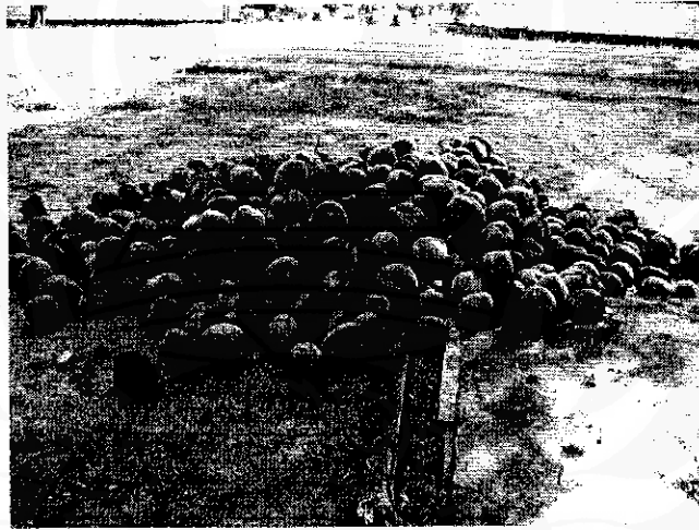
ภาพที่ 6 ผลมะพร้าวที่แก่จัด (มะพร้าวท้าวหรือมะพร้าวสุก)

1. กะลามะพร้าว กะลามะพร้าวที่ใช้ทำผลิตภัณฑ์จากกะลามะพร้าว มีอยู่ 2 ขนาดด้วยกัน คือ ขนาดใหญ่และขนาดเล็ก กะลาขนาดใหญ่จะใช้ทำจาน ชาม โถข้าว เหยือก ชันน้ำ ถ้วยแกง ฯลฯ ส่วนกะลาขนาดเล็กจะใช้ทำแก้วน้ำ แก้วไวน์ ถ้วยกาแฟ ทัพพี ช้อน ช้อนส้อม และเครื่องประดับชิ้นเล็กชิ้นน้อย เช่น กีบติดผม กระดุม ลูกบิด สร้อยคอ และสร้อยข้อมือ เป็นต้น กะลามะพร้าวที่ใช้ในการทำผลิตภัณฑ์จากกะลามะพร้าวจะต้องมาจากผลมะพร้าวที่แก่จัด (มะพร้าวท้าวหรือมะพร้าวสุก)