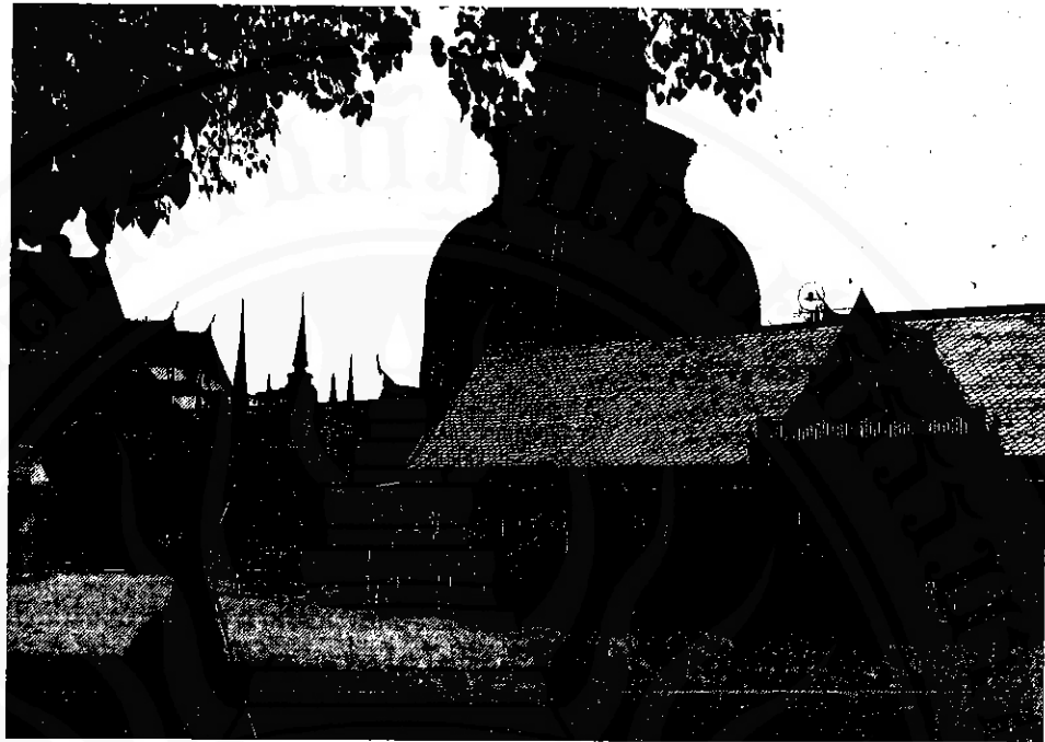
หาดทรายแก้ว ก่อนจะเป็นที่ประดิษฐานพระบรมธาตุเจดีย์ ตำนานเมืองนครศรีธรรมราช ได้กล่าวว่าเป็นหาดทรายอันขาวสะอาดและขาวเหยียดขนานไปกับชายทะเล

๑๑-๑๖) นั้น มีความสัมพันธ์อยู่แต่เฉพาะแนวชายฝั่งทะเลเดิมที่มีระดับความสูง ๓.๕๐-๔.๐๐ เมตร เหนือระดับน้ำทะเลปานกลางในปัจจุบันนี้ อันหมายความว่า ในระหว่างช่วงระยะเวลาที่กล่าวนั้น ระดับน้ำทะเลในบริเวณนี้มีความสูงกว่าระดับน้ำทะเลในปัจจุบัน ประมาณ ๓.๕๐-๔.๐๐ เมตร ดังนั้นในบริเวณนี้พื้นที่ที่ตั้งถิ่นฐานได้จึงมีเฉพาะบนสันทราย บนที่ดอนบนเนินบนโคกหรือพื้นที่ที่สูงกว่านี้เท่านั้น ส่วนพื้นที่ที่มีระดับต่ำกว่านี้ไม่อาจจะใช้ตั้งถิ่นฐานได้ เพราะอยู่ใต้ระดับน้ำทะเล