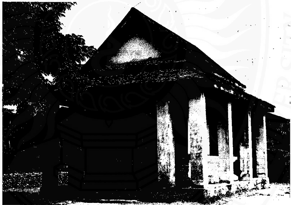
หอพระนารายณ์ ศาสนสถานของพราหมณ์บนหาดทรายแก้วเช่นกัน เป็นอีกที่หนึ่งซึ่งรอการตรวจสอบอายุของรูปแบบเดิมก่อนการบูรณะ