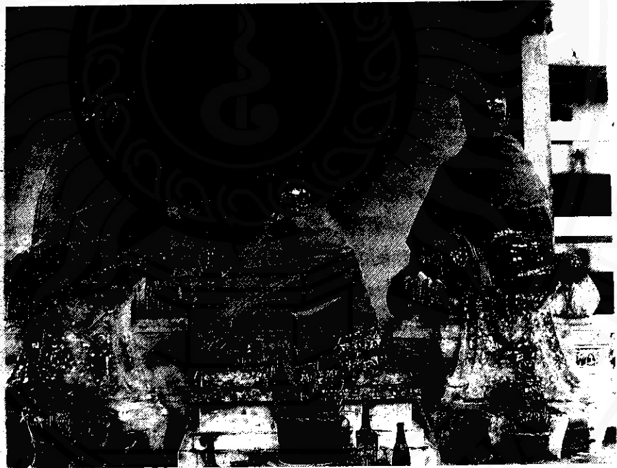
พระพุทธรูปวัดเสมาชัย ประดิษฐานอยู่บริเวณหน้าโรงเรียนเทศบาลวัดเสมาเมือง พื้นที่นี้เดิมเคยเป็นวัดเก่าแก่คือ "วัดเสมาชัย" ปัจจุบันร้างไปแล้ว

แห่งนี้ จำเป็นที่จะต้องดำเนินการขุดค้นทางโบราณคดีในเมืองโบราณแห่งนี้ อย่างพอเพียง และให้กระจายกัน ในจุดต่างๆ ทั้งทั้งหาดทรายแก้วแห่งนี้ แล้วประมวลผลจากการขุดค้นทางโบราณคดีทุกจุด แม้ว่าในขณะนี้ อาจจะสลายไปมากแล้ว เพราะชั้นดินถูกรบกวนไปแทบจะหมดสิ้นแล้ว แต่คาดว่าจะยังคงมีจุดที่ดำเนินการได้อยู่บ้างไม่มากก็น้อย เช่น บริเวณหอพระอิศวร หอพระนารายณ์ วัดเสมาเมือง วัดเสมาชัย วัดพระมหาธาตุวรมหาวิหาร ศาลากลางจังหวัด กำแพงเมือง เมืองพระเวียง ตลอดไปทางด้านทิศเหนือจนถึงท่าศาลา ทางด้านทิศใต้จนถึงสทิงพระ และทางด้านทิศตะวันตกจนถึงพรหมคีรี เป็นต้น โดยควรจะให้ความสนใจเป็นพิเศษกับแหล่งโบราณคดีที่ตั้งอยู่บนสันทรายบนที่ดอน บนเนิน หรือบนโคกอย่างทั่วถึง เนื่องจากได้ปรากฏผลการศึกษาวิจัยของนักวิชาการหลายท่าน เกี่ยวกับความสัมพันธ์ของเมืองโบราณกับชายฝั่งทะเล เดิมว่าความสัมพันธ์ของตำแหน่งที่ตั้งของเมืองโบราณที่มีอายุอยู่ในช่วงระยะเวลาดังกล่าว (ราวพุทธศตวรรษที่