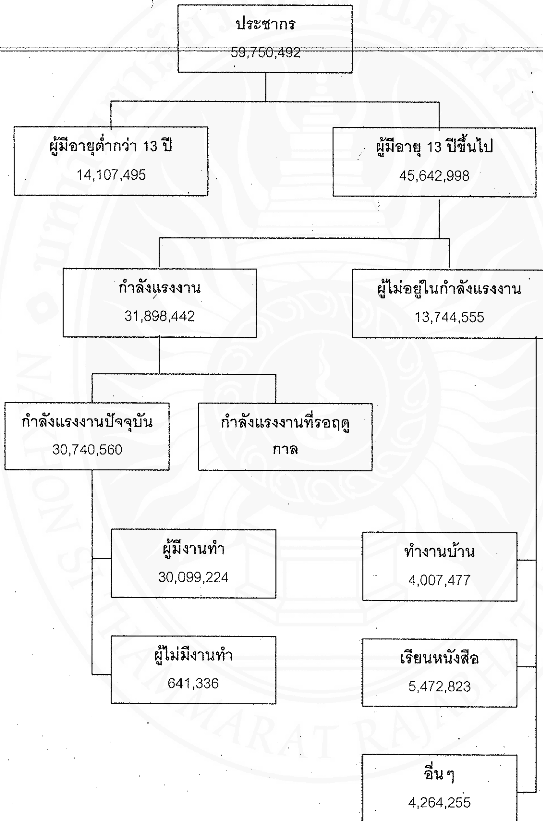
ภาพที่ 1 โครงสร้างประชากร และกำลังแรงงานของประเทศไทยในปี 2539