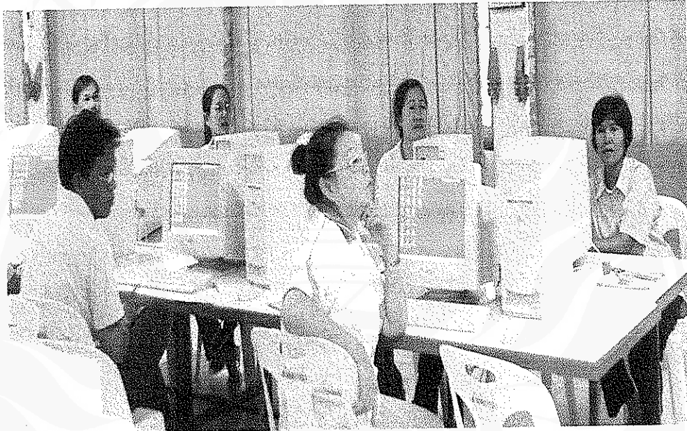
บรรยากาศของการประชุมปฏิบัติการ