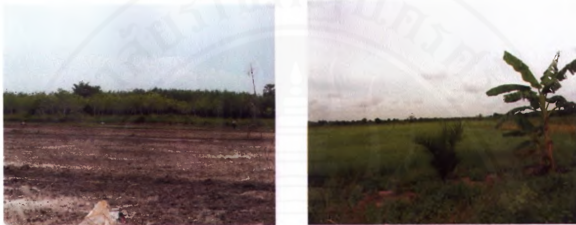
ภาพที่ 4 พื้นที่นาข้าวในพรุควนเคิ่ง

การใช้ประโยชน์ที่ดินและการประกอบอาชีพของชาวบ้านในตำบลเคิ่ง อำเภอลำดวน จังหวัดนครศรีธรรมราช