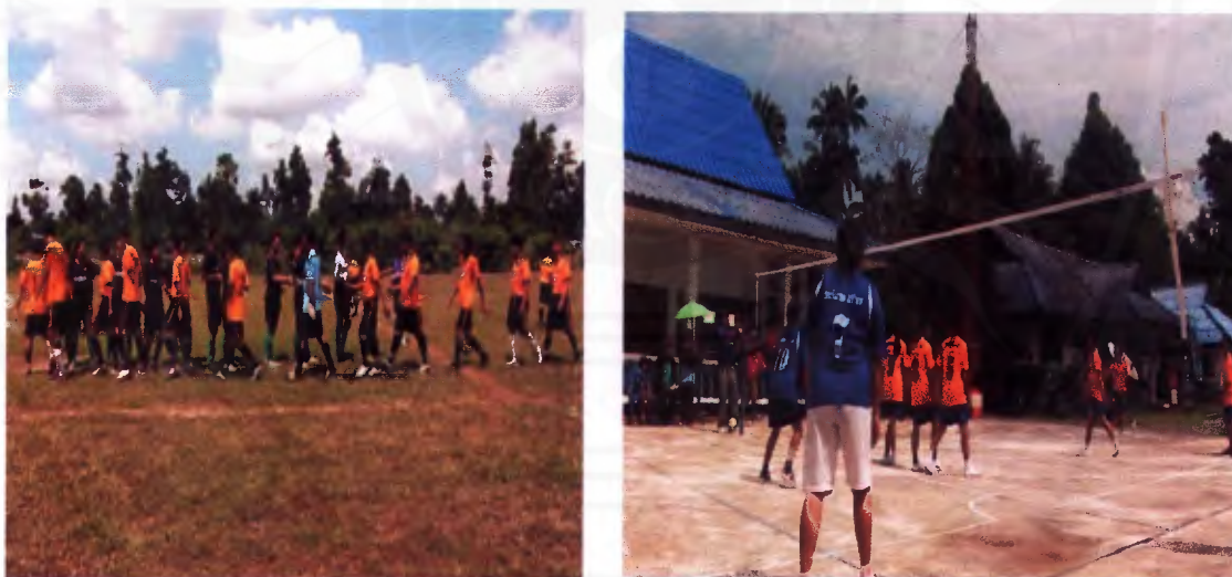
ภาพที่ 13 การแข่งขันกีฬาประจำปีตำบลเคิ่ง