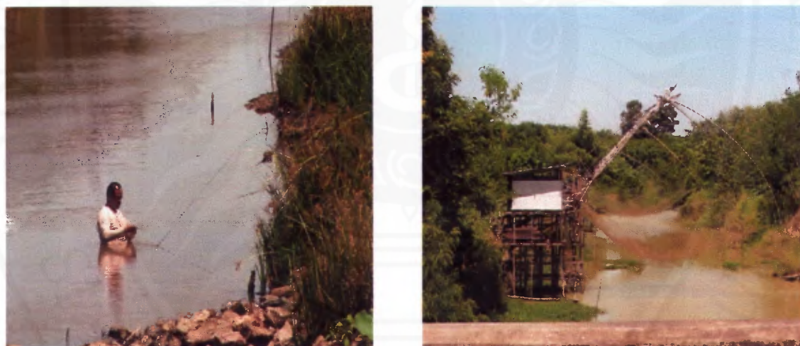
ภาพที่ 5 การใช้อุปกรณ์จับสัตว์น้ำ