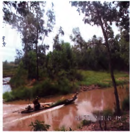
ภาพที่ 6 การเก็บกระดุกจากพรุควนเค็ง