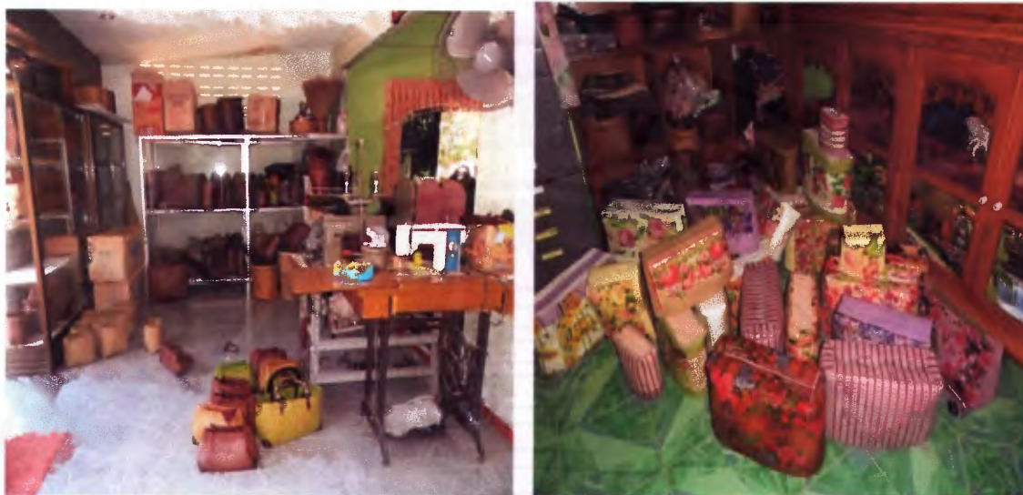
ภาพที่ 12 กลุ่มแปรรูปผลิตภัณฑ์กระจุต