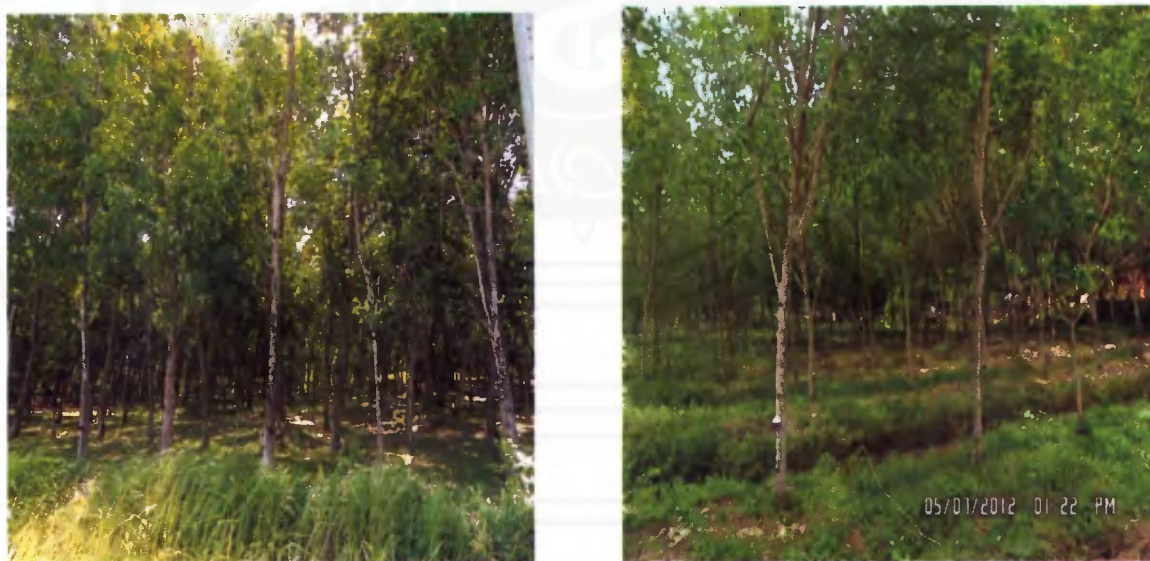
ภาพที่ 9 สวนยางพาราในพรุควนเค็ง