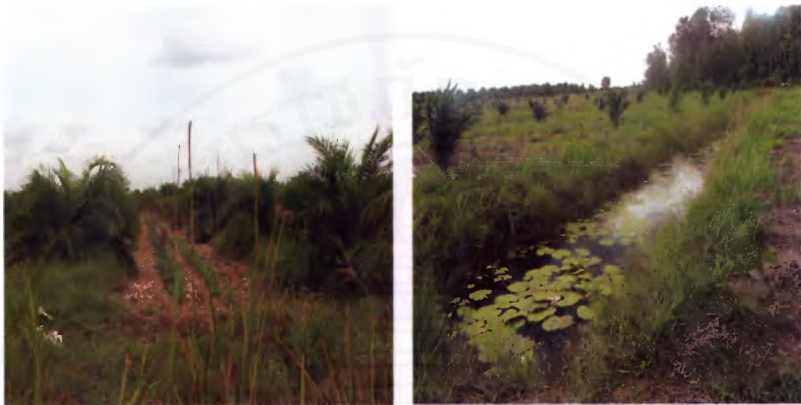
ภาพที่ 8 พื้นที่ปลูกผักในร่องสวนปาล์มและใกล้แหล่งน้ำ