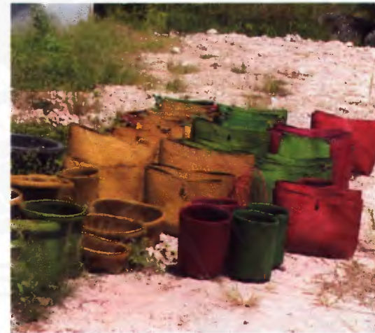
ภาพที่ 7 การจักสานกระดุก