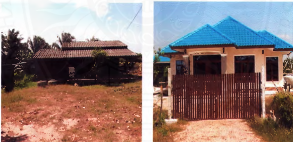
ภาพที่ 11 บ้านเรือนแบบดั้งเดิมและแบบสมัยใหม่