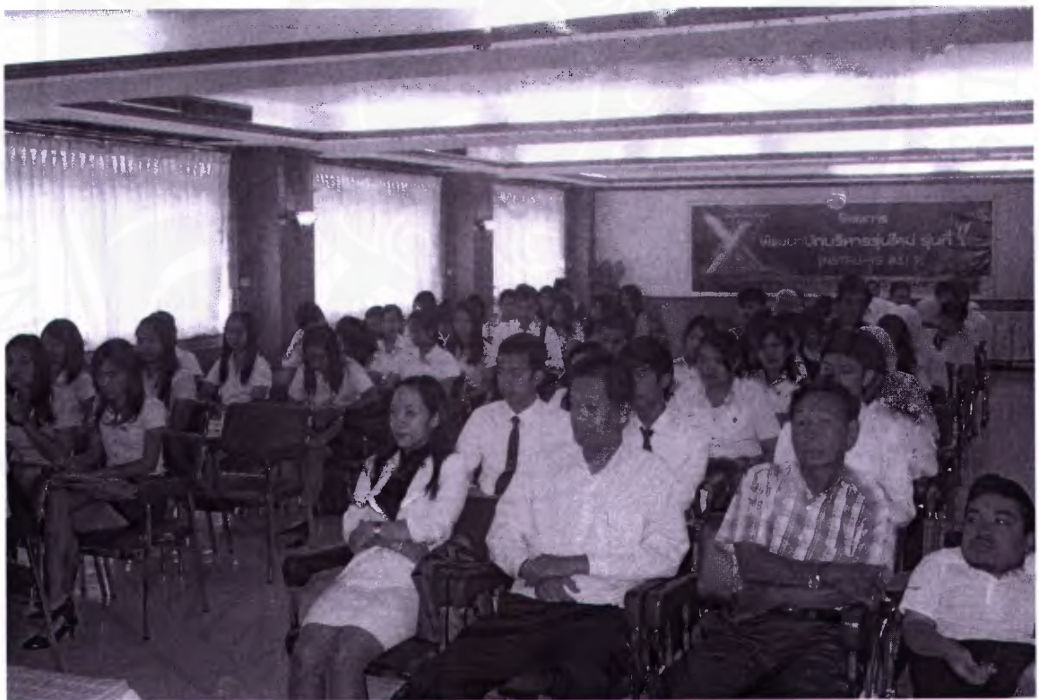
ผู้เข้าร่วมฟังการบรรยาย