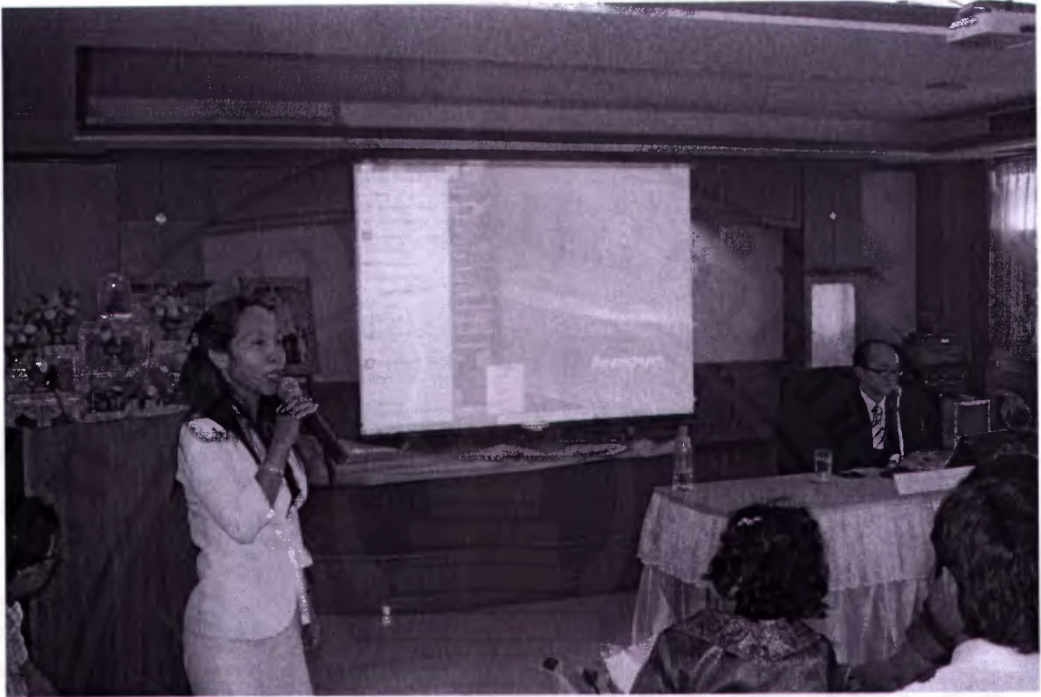
อ.แนนน้อย แสงเสน่ห์กล่าวขอบคุณท่านวิทยากร