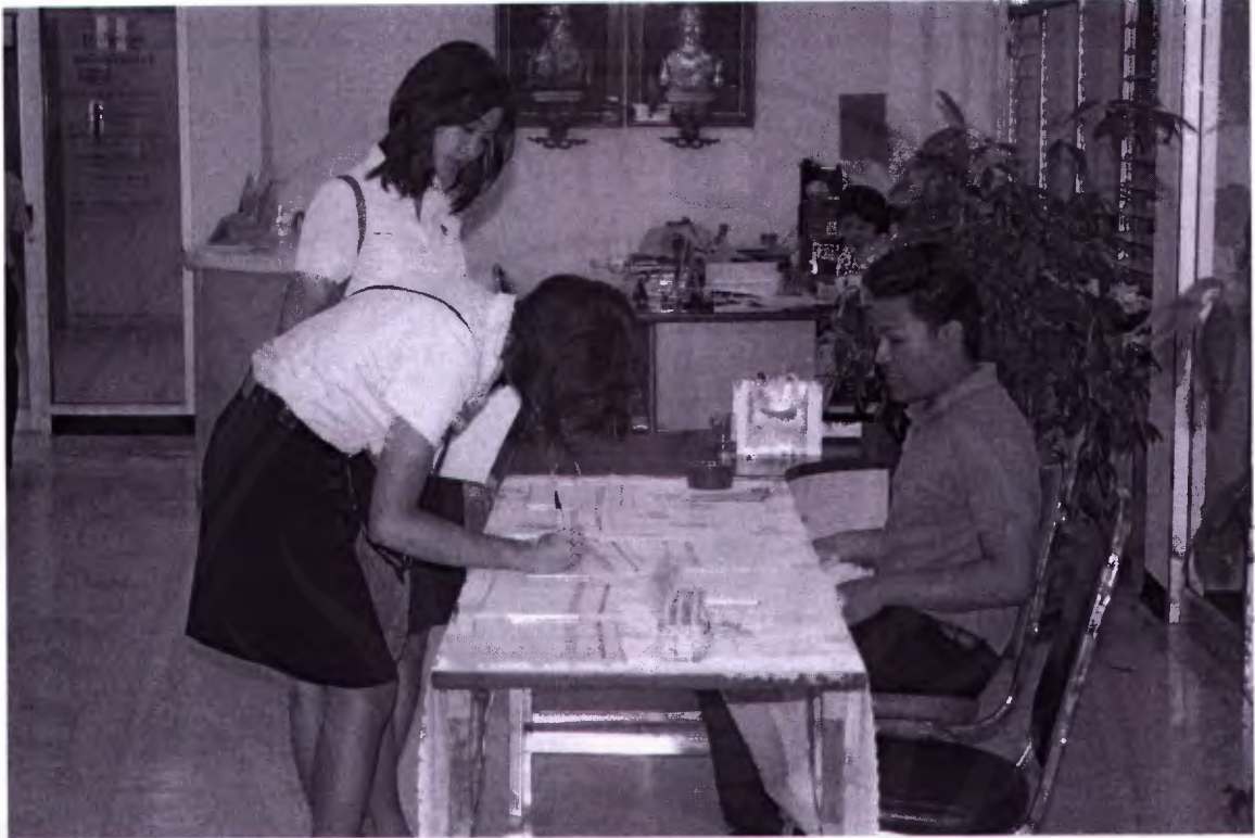
ลงทะเบียนเข้าร่วมการฟังบรรยาย