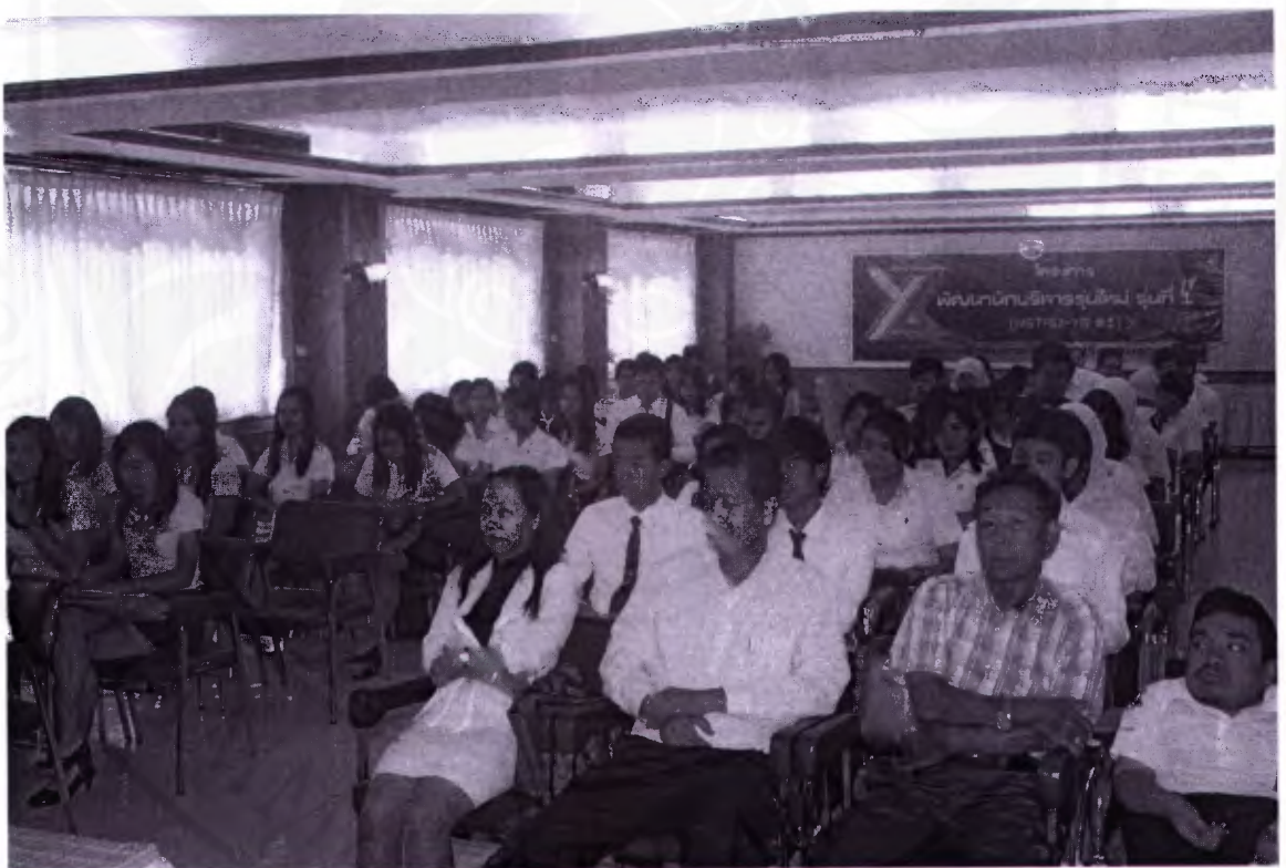
ผู้เข้าร่วมฟังการบรรยาย