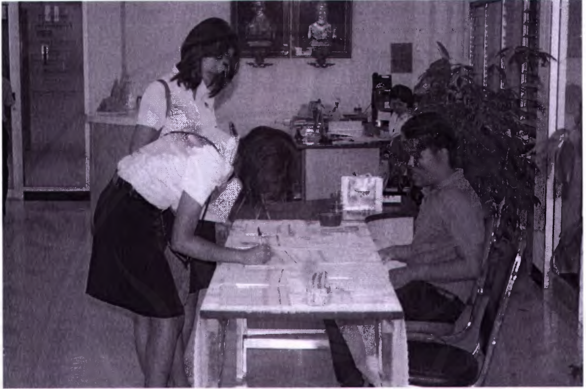
ลงทะเบียนเข้าร่วมการฟังบรรยาย