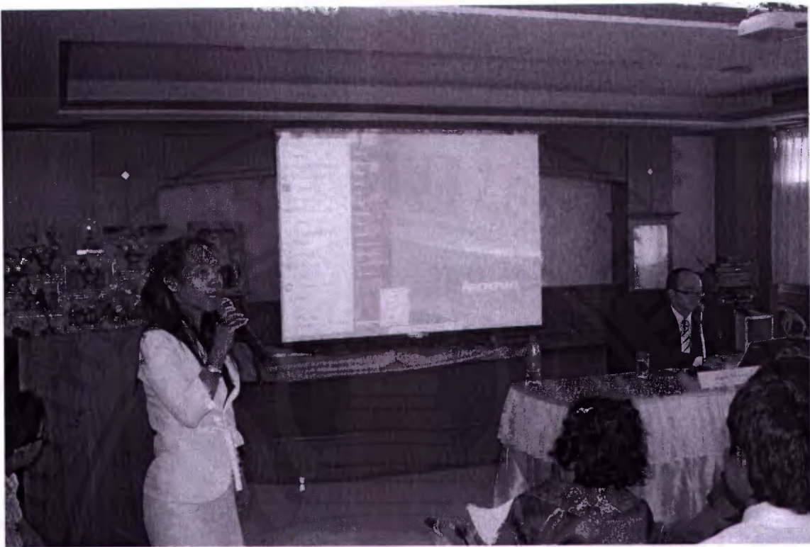
อ.แนนน้อย แสงเสน่ห์กล่าวขอบคุณท่านวิทยากร