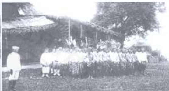
▲ข้าราชการประจำเมือง ส่งเสด็จที่สถานีรถไฟเมืองนครศรีธรรมราช